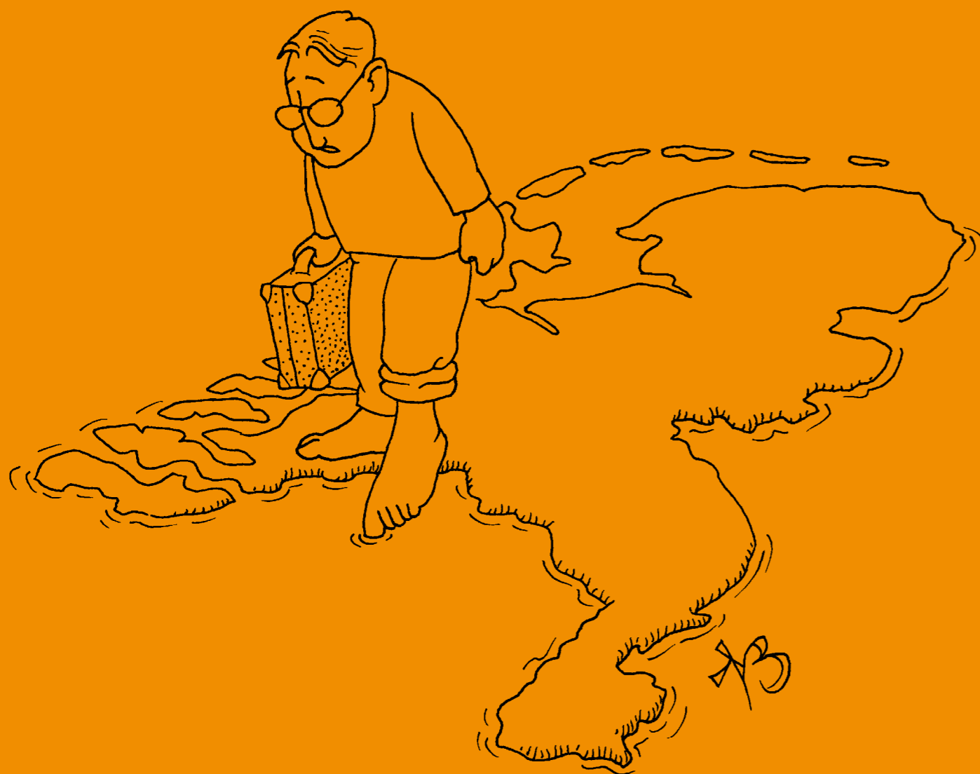
Illustratie: Niels Borgers

Het aantal studenten dat over de grens een opleiding volgt, groeit wereldwijd spectaculair. Nederland pikt daar weliswaar een graantje van mee, maar scoort wat betreft diplomamobiliteit onder het EU-gemiddelde. En er is meer te concluderen uit de Mobiliteitsmonitor 2006, die binnenkort verschijnt.