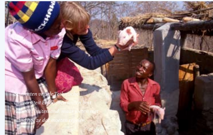
Studenten van de Technische Universiteit Eindhoven willen best naar het buitenland, maar weten niet altijd hoe ze dat moeten regelen.

verhogen, vinden de onderzoekers. Meer nadruk zou moeten worden gelegd op de waarde van de diversiteit en opbrengsten van internationale studenten. Een andere prioriteit is systematische monitoring van de in- en uitstroom van Nederlandse en buitenlandse studenten en kenniswerkers. Ook moet sterker worden ingezet op promotie van het Nederlandse hoger onderwijs. In het najaar presenteert minister Plasterk concrete voorstellen op internationaliseringsgebied. (EH)