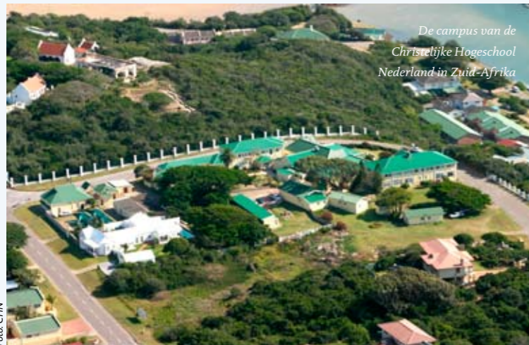
De campus van de Christelijke Hogeschool Nederland in Zuid-Afrika