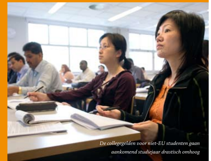
De collegegelden voor niet-EU studenten gaan aankomend studiejaar drastisch omhoog