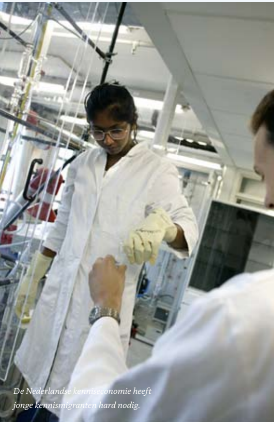
De Nederlandse kenniseconomie heeft jonge kennismigranten hard nodig.