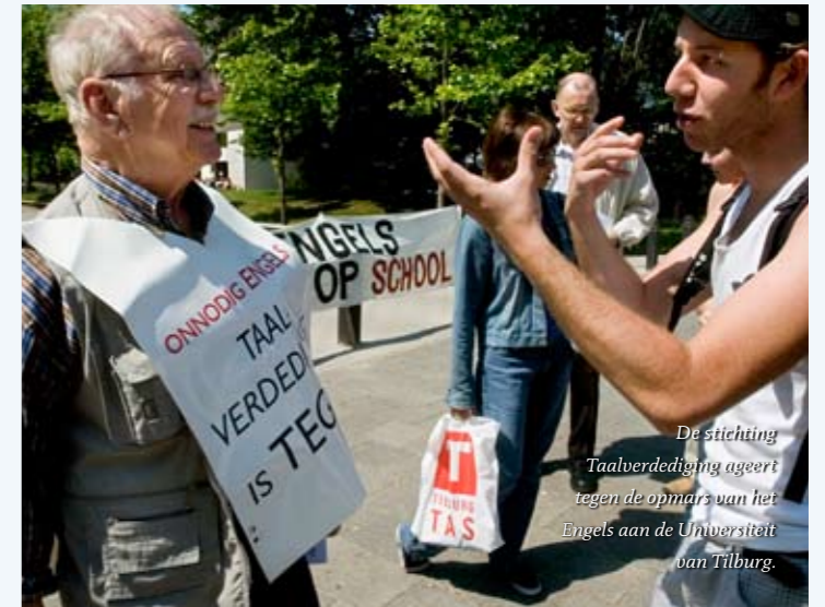
De stichting Taalverdediging ageert tegen de opmars van het Engels aan de Universiteit van Tilburg.

Taalverdediging op de onstuitbare globalisering. "Als we niet meedoen, missen we de boot. We hebben nu een voorsprong, want we spreken beter Engels dan Italianen of Fransen." De actievoerders waren niet onder de indruk van deze argumenten. De jeugd wordt geïndoctrineerd door het Atlantisch wereldbeeld, vinden ze. "Straks is het Nederlands alleen nog een taaltje dat in de keuken wordt gesproken." (EH)