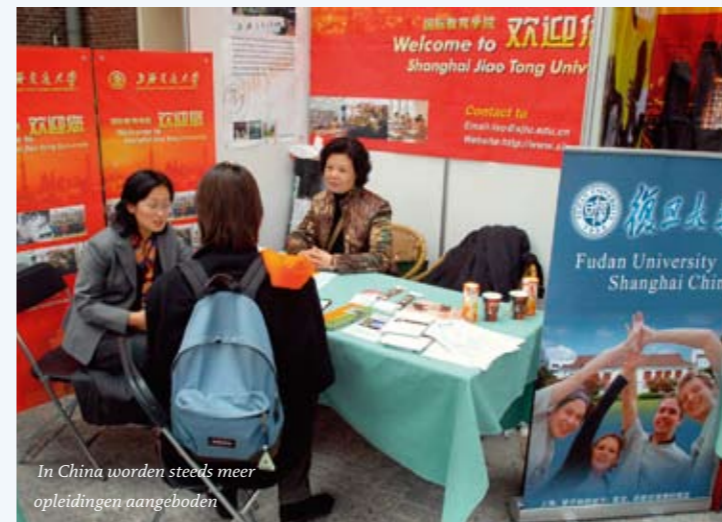
In China worden steeds meer opleidingen aangeboden

De afname betreft vooral technische bacheloropleidingen en het hoger beroepsonderwijs. Het aantal Chinese masterstudenten is tussen vorig jaar en dit jaar wel iets gestegen, vooral in de niet-technische sector, maar over de gehele linie tekent zich ook in het wetenschappelijk onderwijs een daling af. De meeste Chinezen staan momenteel ingeschreven bij Wageningen Universiteit (252 studenten), de TU Delft (244) en de Hogeschool Inholland (237). Cijfers over niet-bekostigd onderwijs zijn niet bekend. (VR)