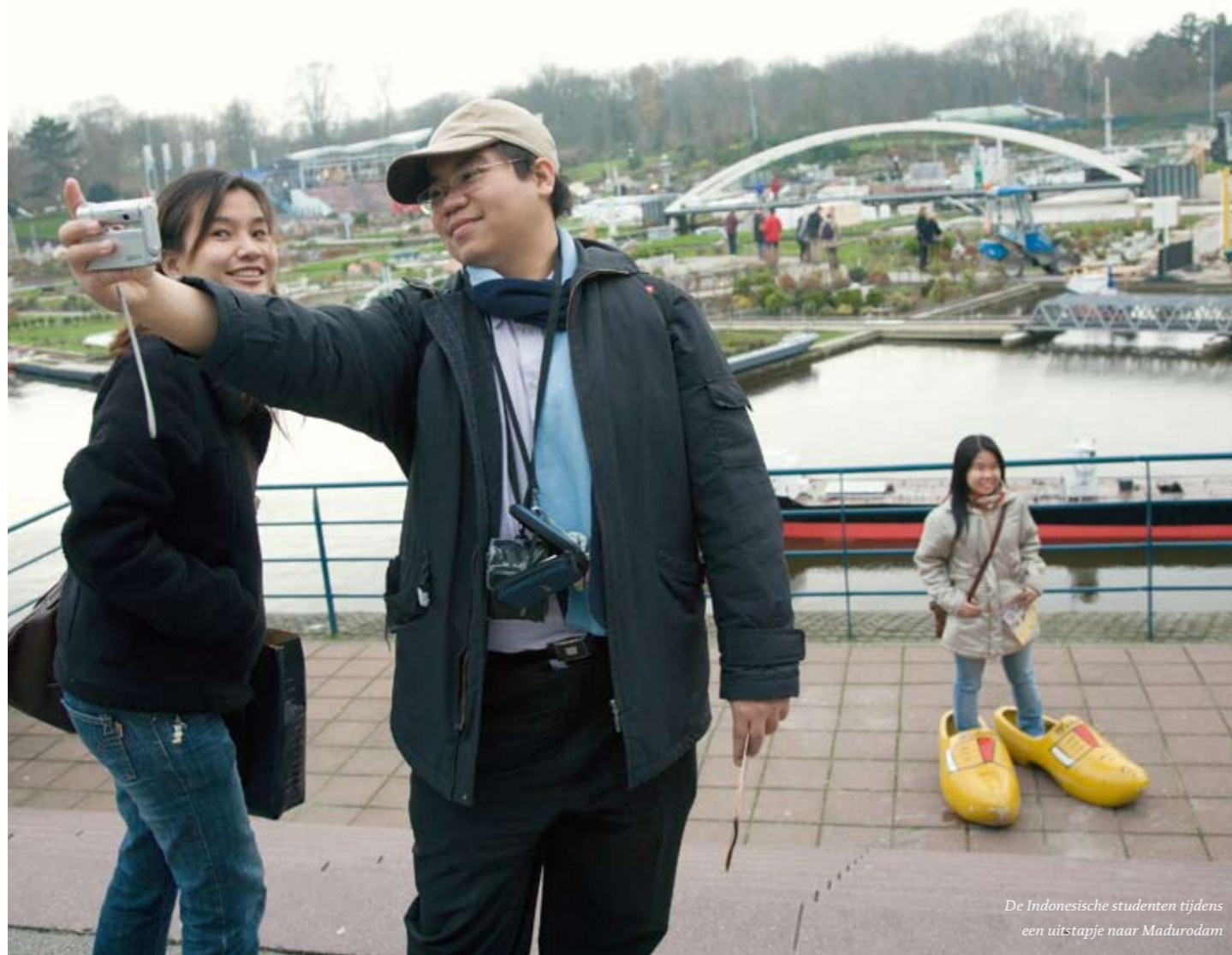
De Indonesische studenten tijdens een uitstapje naar Madurodam

Nederlandse bedrijven zitten te springen om technenuten, maar studenten in deze richting worden steeds schaarser. Het project Existente wil twee vliegen in een klap slaan. Indonesische studenten stromen hier bij een hbo-techniekopleiding in en worden klaargestoomd voor de Nederlandse arbeidsmarkt.