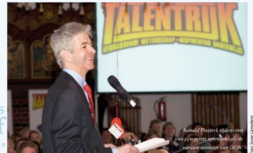
Ronald Plasterk tijdens een van zijn eerste optredens als de nieuwe minister van OCW.

andere universiteit. “Ze wonen voor het eerst zelfstandig, bouwen net een nieuw leven op. Ik denk niet dat studenten zo snel stemmen met hun voeten.” Op de bijeenkomst presenteerden ISO en LSVb gezamenlijk een aantal wensen. Ze willen meer maatwerk voor studenten, meer onderzoeksplaatsen aan universiteiten en daarbuiten, en meer geïnspireerde, goede onderzoekers als docenten. (DVD)