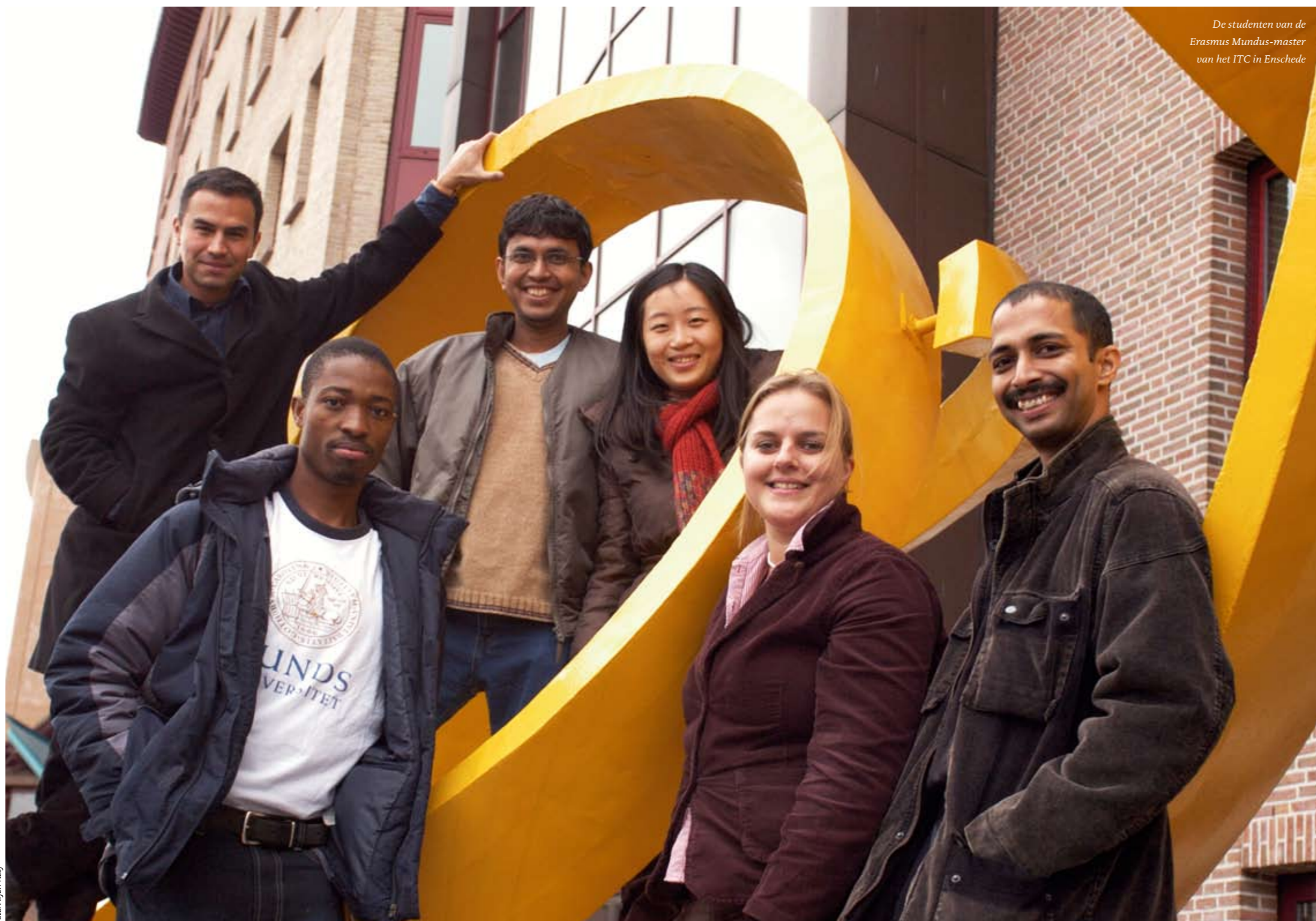
De studenten van de Erasmus Mundus-master van het ITC in Enschede

Erasmus Mundus-masters betekenen voor de studenten veel reizen, veel verschillende indrukken opdoen en keihard studeren. De deelnemende universiteiten in de diverse landen hebben vooral te maken met verschillen in cultuur, wetgeving en onderwijssysteem. Erasmus Mundus is voor iedereen aanpoten. Maar het enthousiasme is groot.