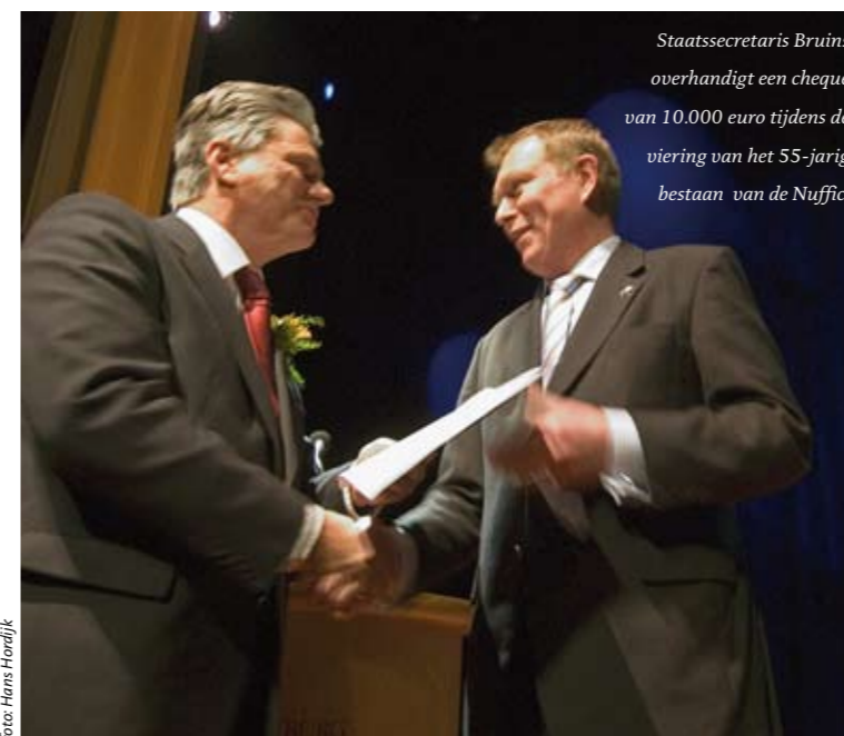
Staatssecretaris Bruins overhandigt een cheque van 10.000 euro tijdens de viering van het 55-jarig bestaan van de Nuffic.