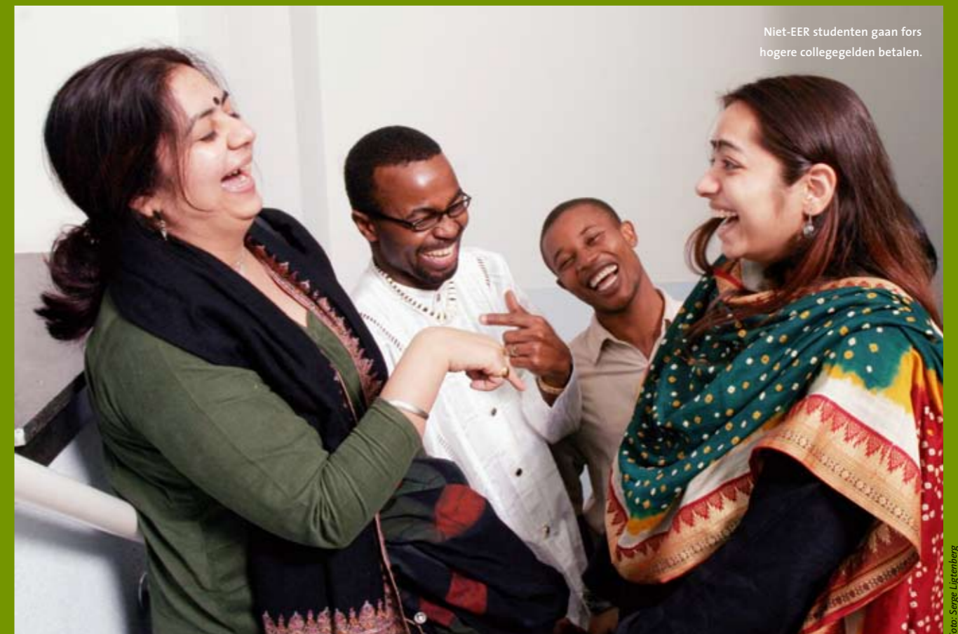
Niet-EER studenten gaan fors hogere collegegelden betalen.