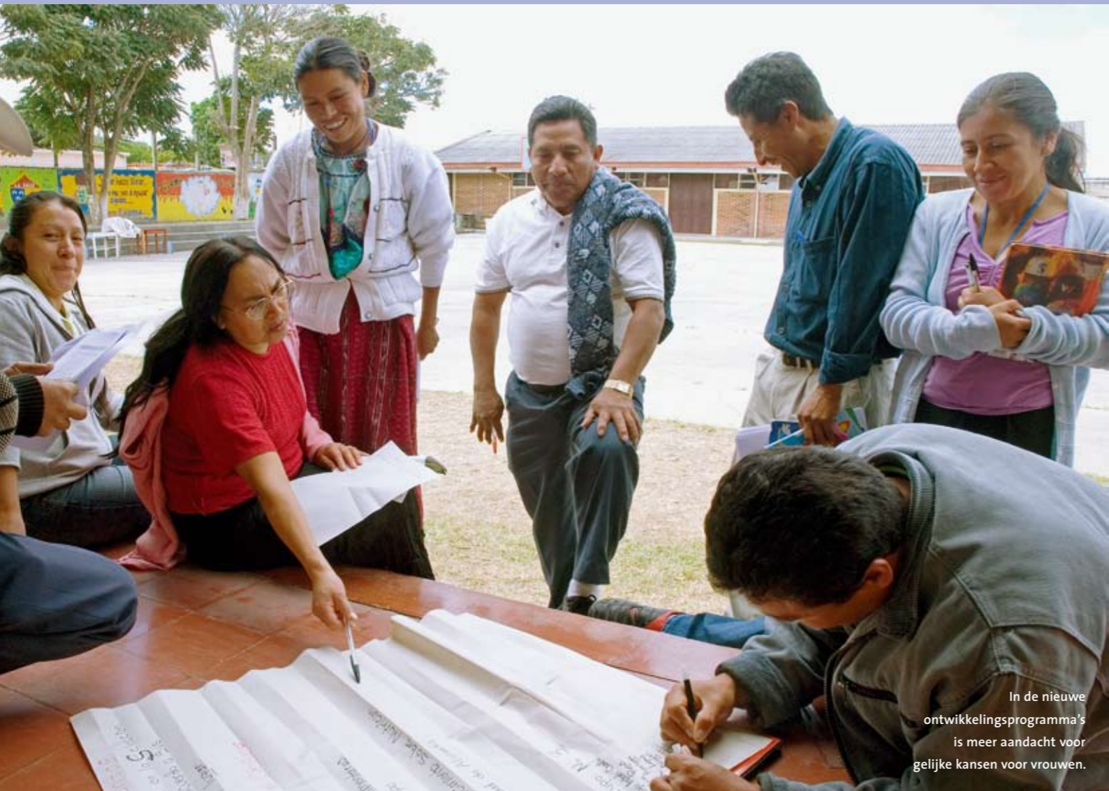
In de nieuwe ontwikkelingsprogramma's is meer aandacht voor gelijke kansen voor vrouwen.

Eindelijk is er meer duidelijkheid over de ontwikkelingsprogramma's NFP en NPT. Minister Koenders heeft de Tweede Kamer een lijst met 'verbeterpunten' gestuurd waarmee de betrokken partijen aan de slag kunnen. Transfer peilde de meningen in het veld.