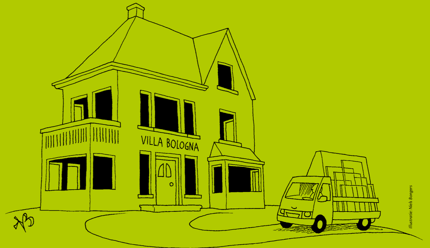
Illustratie: Niels Bongers