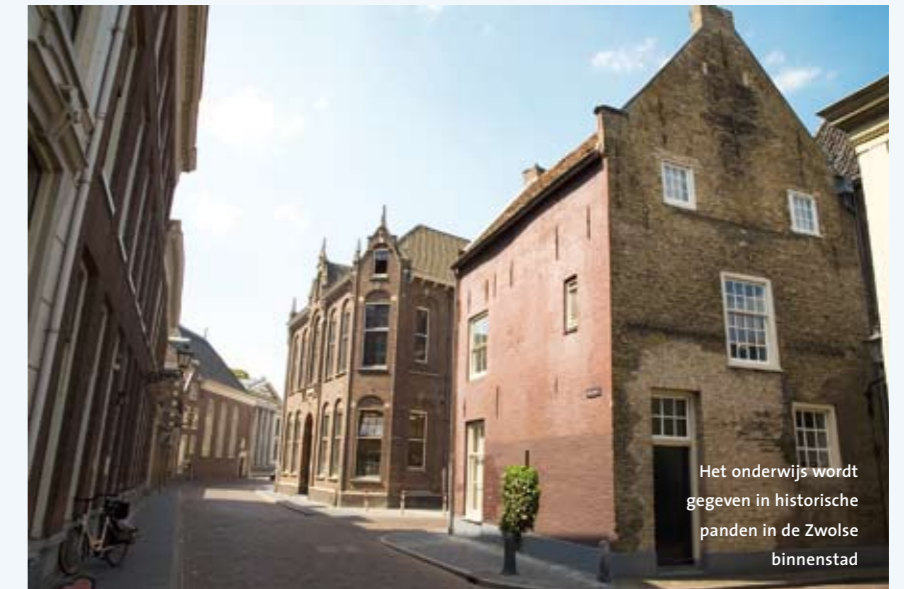
Het onderwijs wordt gegeven in historische panden in de Zwolse binnenstad