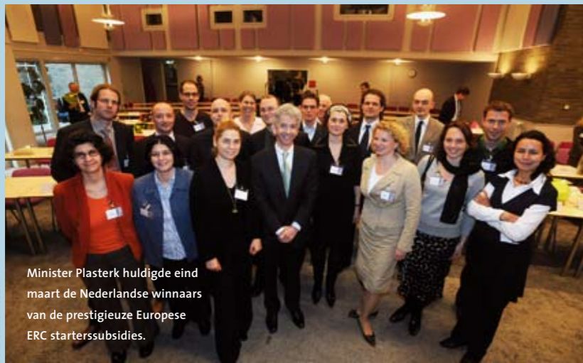
Minister Plasterk huldigt de Nederlandse winnaars van de prestigieuze Europese ERC startersubsidies.

Nederland heeft het erg goed gedaan bij de verdeling van de eerste startersubsidies van de European Research Council (ERC). Zeker 22 Nederlandse onderzoekers krijgen ieder tot 2 miljoen euro om een eigen onderzoeksgroep op te zetten. Daarmee staat Nederland vierde in Europa, na Groot-Brittannië, Frankrijk en Duitsland. De startersubsidies zijn bedoeld om jonge, talentvolle onderzoekers in staat te stellen een onafhankelijke