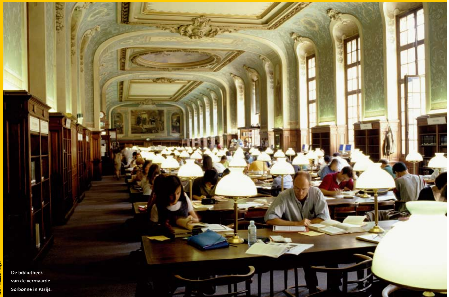
De bibliotheek van de vermaarde Sorbonne in Parijs.