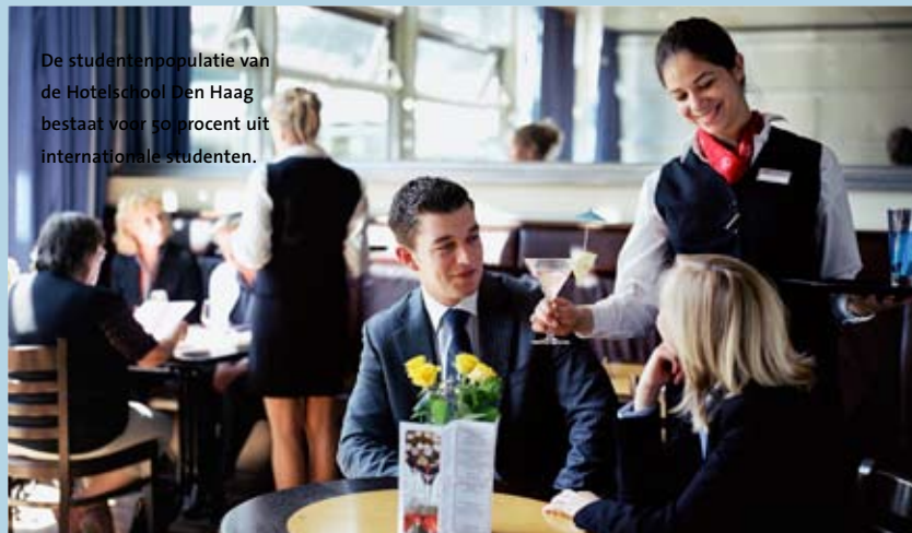
De studentenpopulatie van de Hotelschool Den Haag bestaat voor 50 procent uit internationale studenten.

De Hotelschool Den Haag is overgestapt op een volledig Engelstalig onderwijsprogramma. De lichte studenten die afgelopen februari met de opleiding is begonnen, krijgt uitsluitend les in het Engels. De reden daarvoor is dat de afgelopen jaren steeds meer Nederlandse studenten