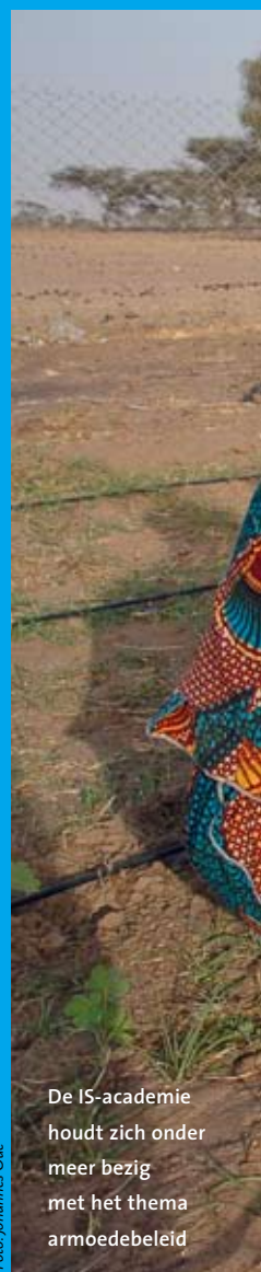
De IS-academie houdt zich onder meer bezig met het thema armoedebeleid