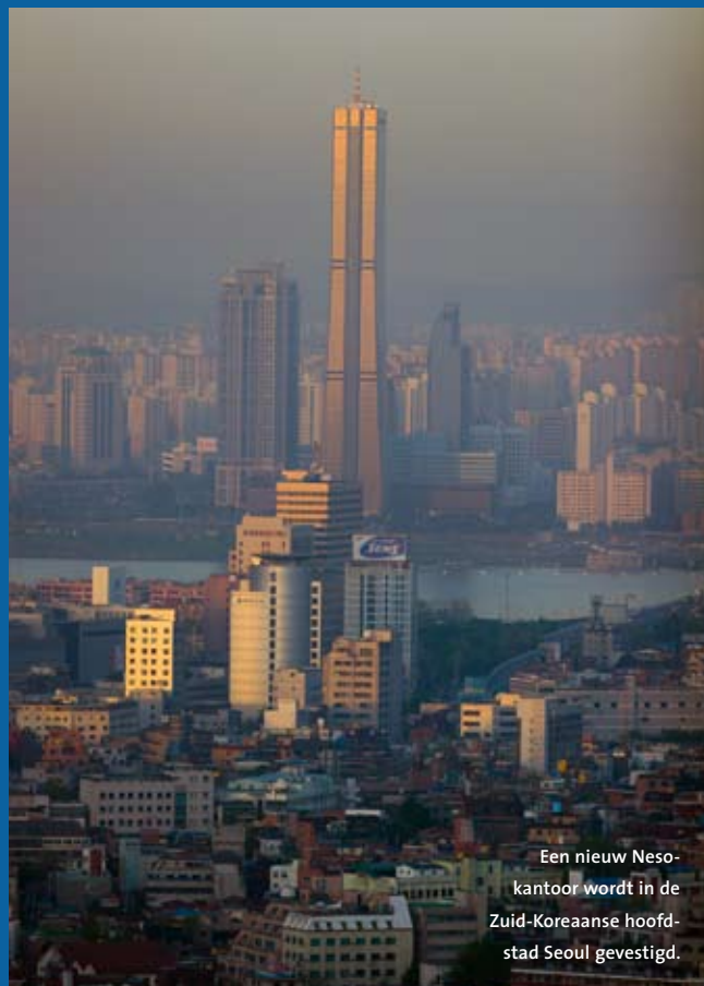
Een nieuw Neso-kantoor wordt in de Zuid-Koreaanse hoofdstad Seoul gevestigd.