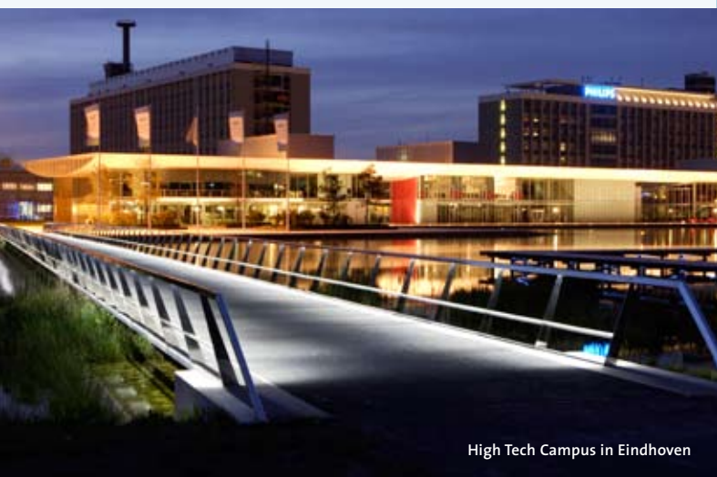
High Tech Campus in Eindhoven

KP7 is het grootste Europese subsidieprogramma voor onderzoek en technologie-ontwikkeling met een budget van ruim 50 miljard euro. De ICT-oproep, waarmee een bedrag van 1,2 miljard euro is gemoeid, geldt tot nu toe als de grootste binnen de Kaderprogramma's. KP7 loopt tot en met 2013. Aan KP7-projecten in het programma Cooperation nemen partners uit minimaal drie verschillende lidstaten deel. De komende maanden worden de resultaten van de overige programmablokken verwacht. Dat zijn onder meer 'Ideas' (voor grensverleggend onderzoek), energie, gezondheid en nanowetenschappen. (VR)