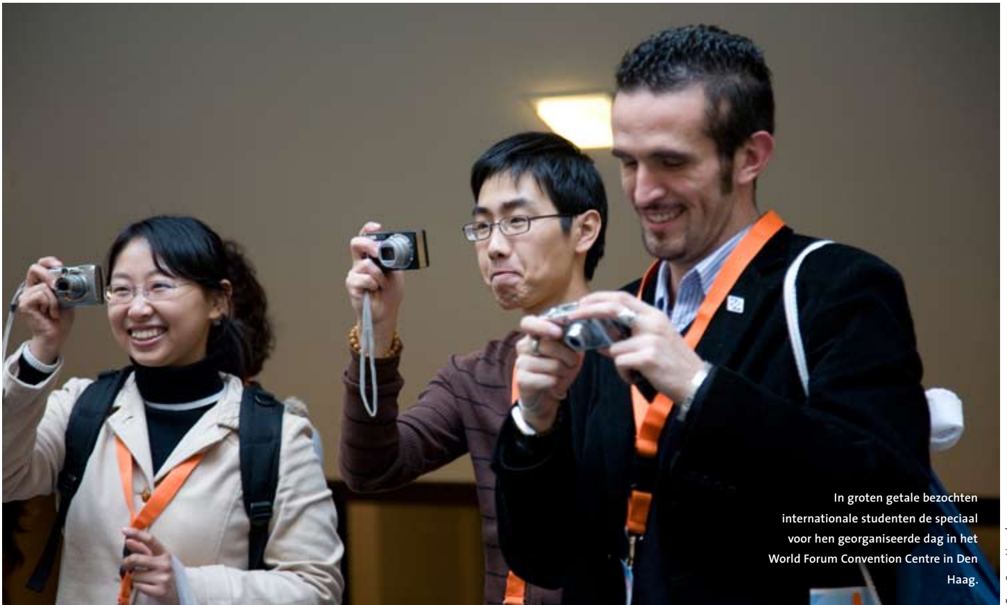
In groten getale bezochten internationale studenten de speciaal voor hen georganiseerde dag in het World Forum Convention Centre in Den Haag.