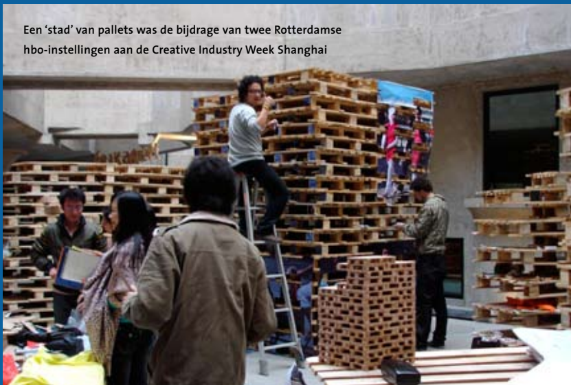
Een 'stad' van pallets was de bijdrage van twee Rotterdamse hbo-instellingen aan de Creative Industry Week Shanghai

De Dutch Design Expo vormde de opening van de Creative Industry Week Shanghai, een internationale beurs om Shanghai als creatief centrum te promoten. Ook buitenlandse bedrijven konden er zich aan de Chinese markt presenteren. Het ging vooral om bedrijven in de (landschaps)architectuur, mode en kunst in de openbare ruimte. Ook bedrijven als Heineken en Philips waren aanwezig. Dankzij een initiatief van het Nederlandse consulaat in Shanghai namen dit keer voor het eerst eveneens onderwijsinstellingen deel aan deze internationale beurs. De WdK heeft verschillende samenwerkingsprojecten met Chinese instellingen. De studenten kunnen met hun inzet in Shanghai studiepunten verdienen. (EH)