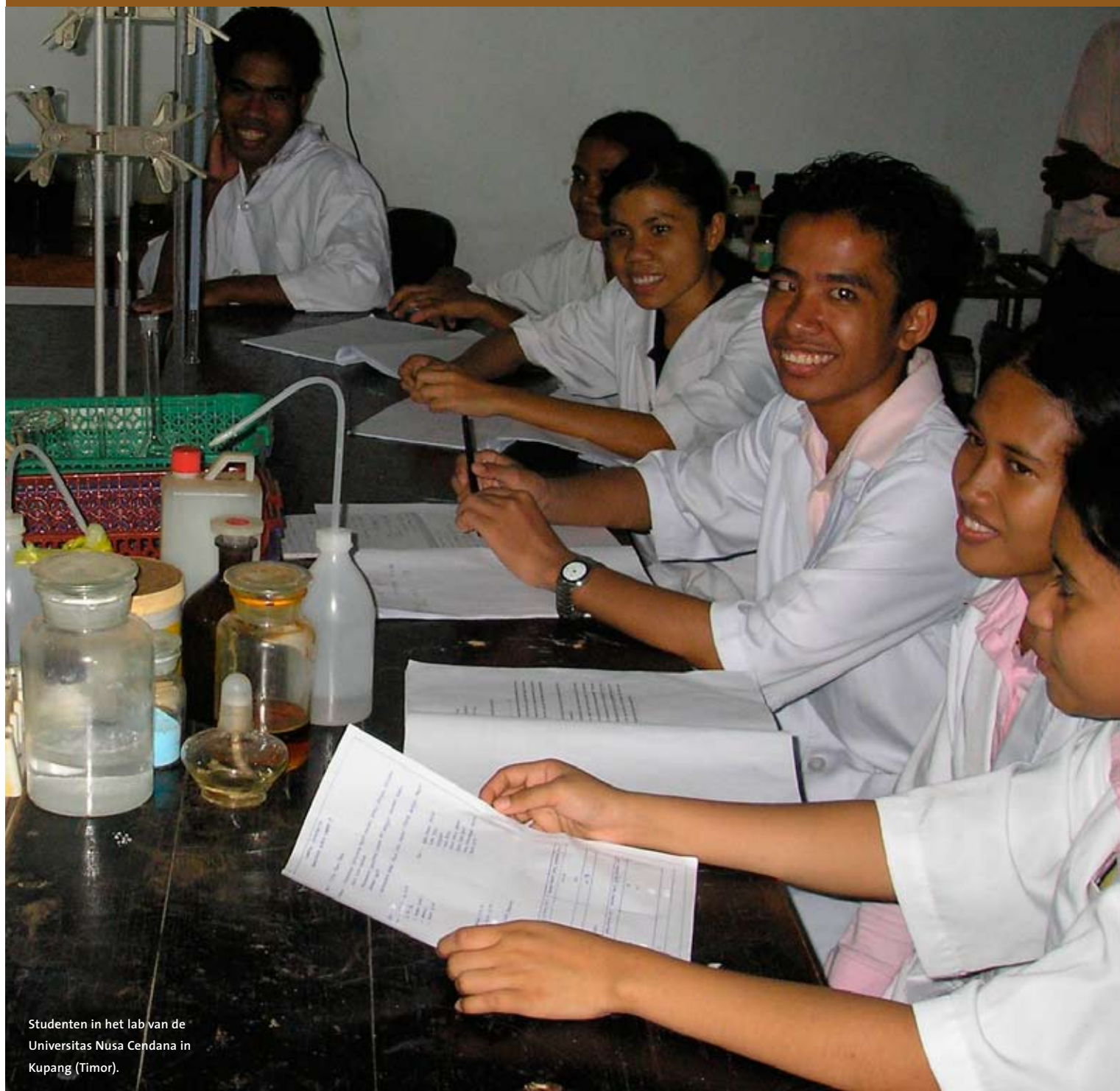
Studenten in het lab van de Universitas Nusa Cendana in Kupang (Timor).