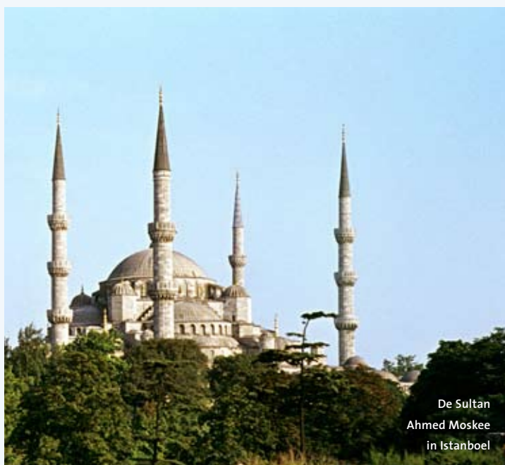
De Sultan Ahmed Moskee in Istanboel

Het is niet de eerste keer dat de IND stappen onderneemt tegen een buitenlandse student. Vorig jaar werd de verblijfsvergunning van een Marokkaanse student in Delft ingetrokken. Deze had meer uren gewerkt dan wettelijk toegestaan. De rechtszaak tegen die beslissing loopt nog. Verder dreigen twee Wageningse studenten uit China en Kameroen hun verblijfsvergunning te verliezen omdat hun bestuursbeurs – de twee zijn bestuurslid van een vereniging – de kosten van hun levensonderhoud niet zou dekken. (VR)