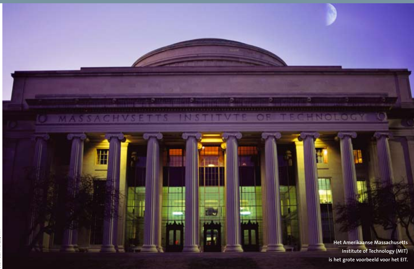
Het Amerikaanse Massachusetts Institute of Technology (MIT) is het grote voorbeeld voor het EIT.

De financiën waren de afgelopen maanden het hete hangijzer in de debatten over het instituut. Die zijn nu rond: tot 2013 wordt 309 miljoen euro geïnvesteerd om het EIT op poten te zetten. Dat bedrag komt onder meer uit niet bestede landbouw-gelden en uit een potje voor onvoorziene omstandigheden. Verder is een zogeheten identificatiebestuur ingesteld, dat vóór maart 2008 de bestuursraad zal selecteren. De nieuwe bestuursraad krijgt vervolgens achttien maanden de tijd om een organisatiestructuur op te zetten. De raad zal ook, tegen de zomer van 2009, de eerste ronde voorstellen van de consortia behandelen. De eerste gezamenlijke opleidingen onder EIT-vlag beginnen naar verwachting in het collegejaar 2010–2011.