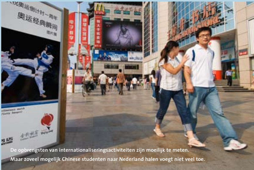
De opbrengsten van internationaliseringsactiviteiten zijn moeilijk te meten. Maar zoveel mogelijk Chinese studenten naar Nederland halen voegt niet veel toe.

De scholen moeten internationaal ondernemen centraal stellen, vindt Zwarts. Het pas gelanceerde programma internationalisering beroepsonderwijs speelt daarbij een voortrekkersrol. “We moeten publieke en private krachten bundelen op dit gebied. Dat is van levensbelang voor onze economie.” (EH)