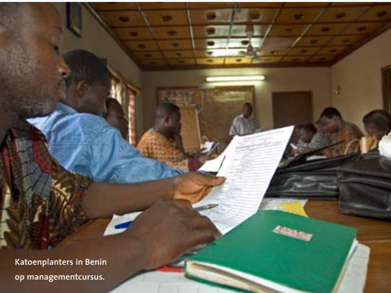
Katoenplanters in Benin op managementcursus.