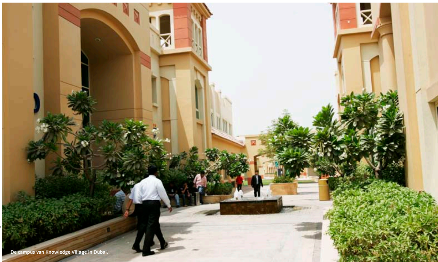
De campus van Knowledge Village in Dubai.

vóór '11 september' de Verenigde Staten de populairste bestemming, inmiddels kijken de Golfstaten ook naar Europa. Zo ontvingen de universiteiten van Groningen en Maastricht vorig jaar voor het eerst tachtig Saoedische full fee paying studenten voor de opleiding geneeskunde.