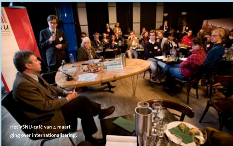
Het VSNU-café van 4 maart ging over internationalisering.