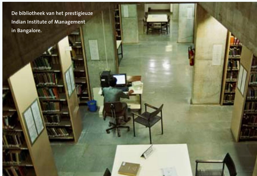
De bibliotheek van het prestigieuze Indian Institute of Management in Bangalore.

Een aantal universiteiten heeft onder aanvoering van de VSNU in maart een bezoek gebracht aan India. Doel van de zevendaagse missie was de bekendheid van de Nederlandse universiteiten te vergroten. De delegatie sprak onder meer met het Indiase ministerie van hoger onderwijs, de Association of Indian Universities en bestuurders van universiteiten. Nederlandse universiteiten willen graag samenwerken met Indiase topinstellingen, maar de concurrentie is groot. Als opkomende