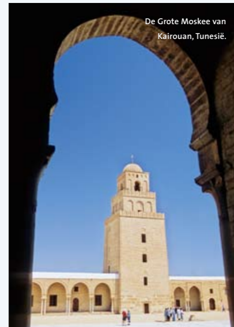
De Grote Moskee van Kairouan, Tunesië.

Een pluspunt van Nederland is dat hier de mogelijkheid wordt geboden om na afloop van de studie een jaar lang te zoeken naar een baan. Juist die combinatie van studie en werk is voor veel Chinezen een aantrekkelijke optie, aldus Van Vliet. “Buitenlandse studie-ervaring is al niet meer zo bijzonder in China, buitenlandse werkervaring wel.” (EH)