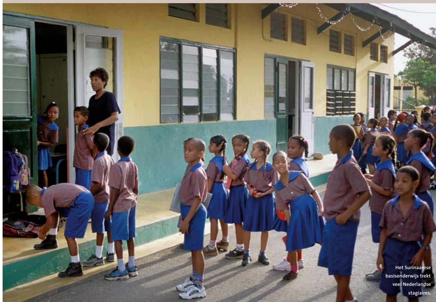
Het Surinaamse basisonderwijs trekt veel Nederlandse stagiaires.