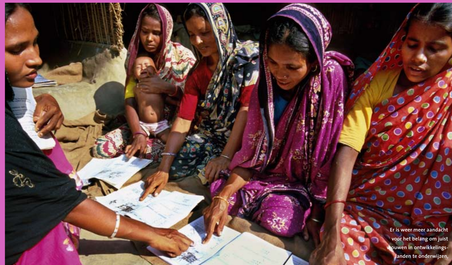
Er is weer meer aandacht voor het belang om juist vrouwen in ontwikkelingslanden te onderwijzen.

“Wat heeft de aanleg van elektriciteit nu met gender te maken?”