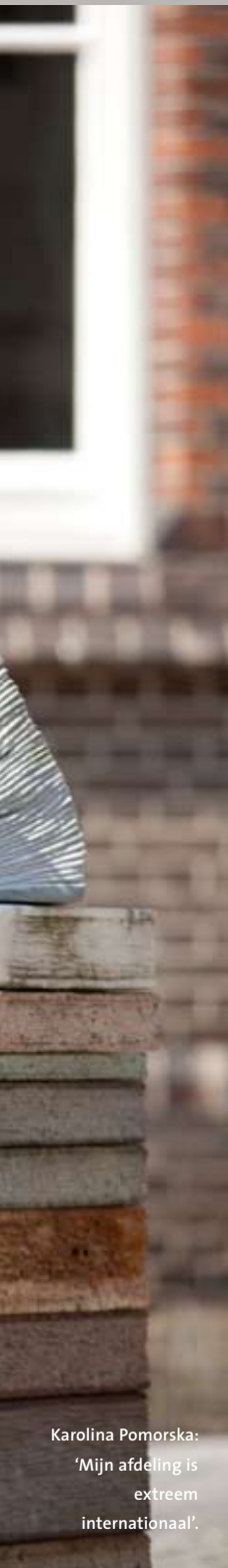
Karolina Pomorska: 'Mijn afdeling is extreem internationaal'.