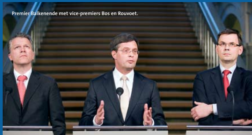
Premier Balkenende met vice-premiers Bos en Rouvoet.

keet ontevreden en verwijten het kabinet een gebrek aan ambitie. "De focus op het OESO-gemiddelde voor onderwijs, kennis en innovatie doet vermoeden dat het kabinet de ambitie heeft laten varen om Nederland terug te brengen in de kopgroep van kennis-economieën." (EB)