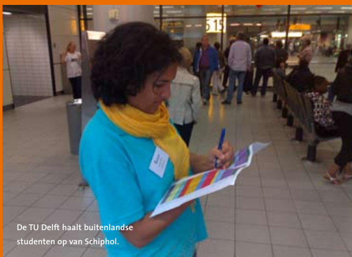
De TU Delft haalt buitenlandse studenten op van Schiphol.

De overige zes dagen staat het onderwijs centraal. In groepjes van acht studenten wordt gewerkt aan een miniproject. “Het gaat niet zozeer om het onderwerp”, legt Hofstra uit, “maar om ze te laten kennismaken met het Nederlandse hoger onderwijs waarin de nadruk ligt op zelfstandig leren, groepsdiscussies en samenwerken in groepen. Wij vinden het belangrijk dat de internationale studenten assertief in het onderwijs staan.” (EH)