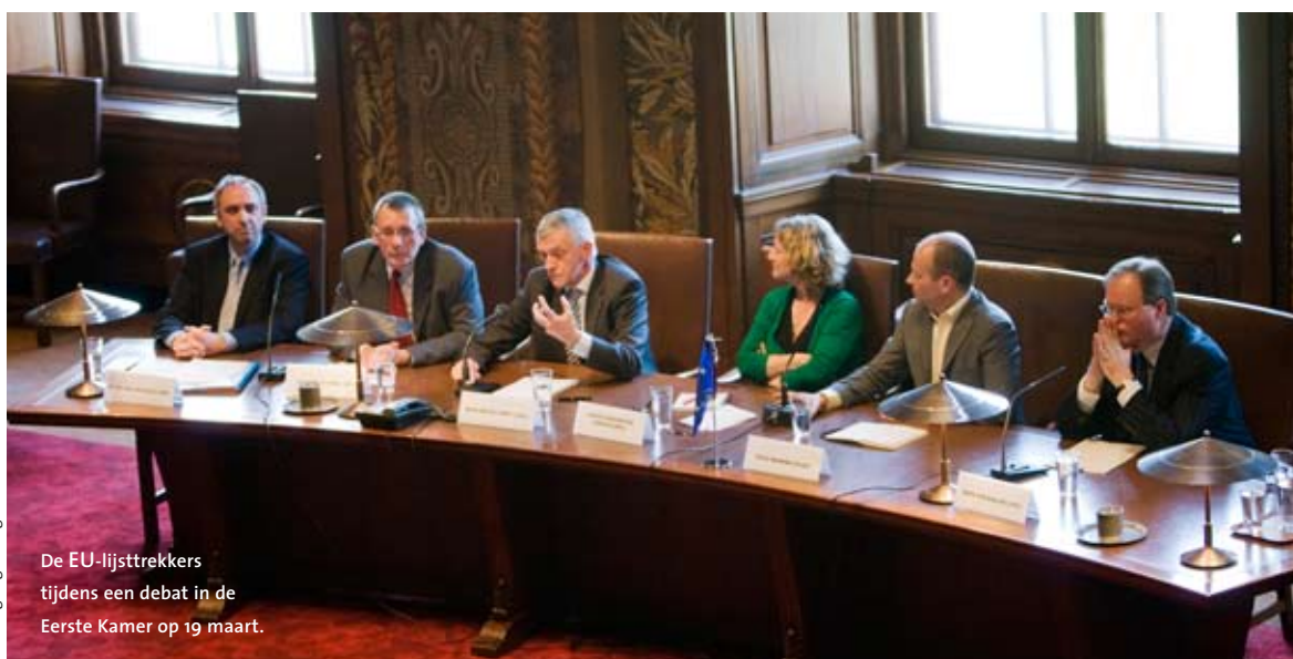
De EU-lijsttrekkers tijdens een debat in de Eerste Kamer op 19 maart.