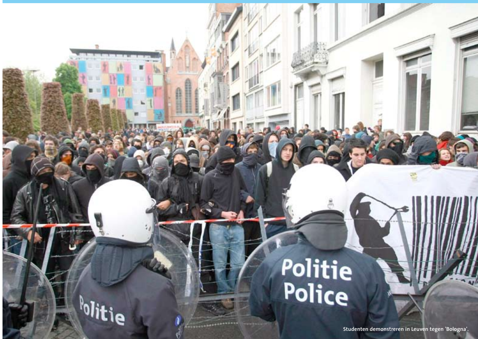
Studenten demonstreren in Leuven tegen 'Bologna'.

De Europese onderwijsministers stomen door. Hoewel nog lang niet alle afspraken over het creëren van een Europese hogeronderwijsruimte zijn nagekomen, stelden de 'Bolognaministers' zich eind april in Leuven alweer nieuwe doelen.