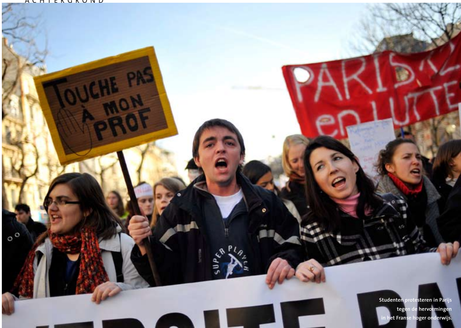
Studenten protesteren in Parijs tegen de hervormingen in het Franse hoger onderwijs.

FRANSE PROTESTACTIES DUPEREN BUITENLANDSE STUDENTEN