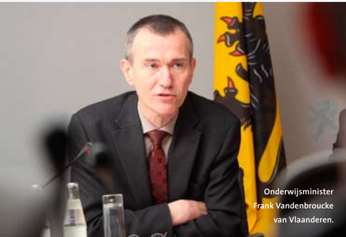
Onderwijsminister Frank Vandenbroucke van Vlaanderen.

Britse universiteiten beginnen zich zorgen te maken over concurrentie van Duitsland, Nederland en Zweden – landen die steeds meer internationale studenten trekken. Dat blijkt uit een rapport van de UK Higher Education Europe Unit . Het rapport vergelijkt internationaliseringsactiviteiten in zeven Europese landen met de inspanningen in Groot-Brittannië. Vooral Duitsland en Nederland vormen een bedreiging, omdat deze landen zich, net als de Britten, op landen als China en India richten en steeds meer Engelstalige opleidingen aanbieden. Deze zijn vaak ook nog eens goedkoper. Volgens de auteurs van het rapport moeten Britse universiteiten vaker partnerschappen sluiten met buitenlandse universiteiten, zoals Duitsland en Nederland doen. Ook moet meer werk worden gemaakt van het Bolognaproces. (EB)