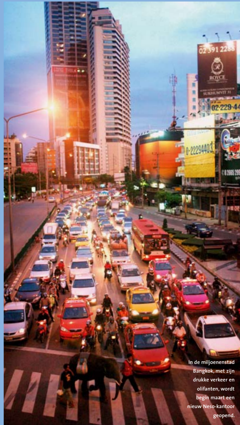
In de miljoenenstad Bangkok, met zijn drukke verkeer en olifanten, wordt begin maart een nieuw Neso-kantoor geopend.

Politici dienen hierbij als voorbeeld, zegt Ten Brummelhuis. "De huidige minister van Buitenlandse Zaken heeft op het Institute of Social Studies hier in Nederland gestudeerd, en de premier in Oxford. Ik denk wel dat dat invloed heeft op het prestige van buitenlandse opleidingen."