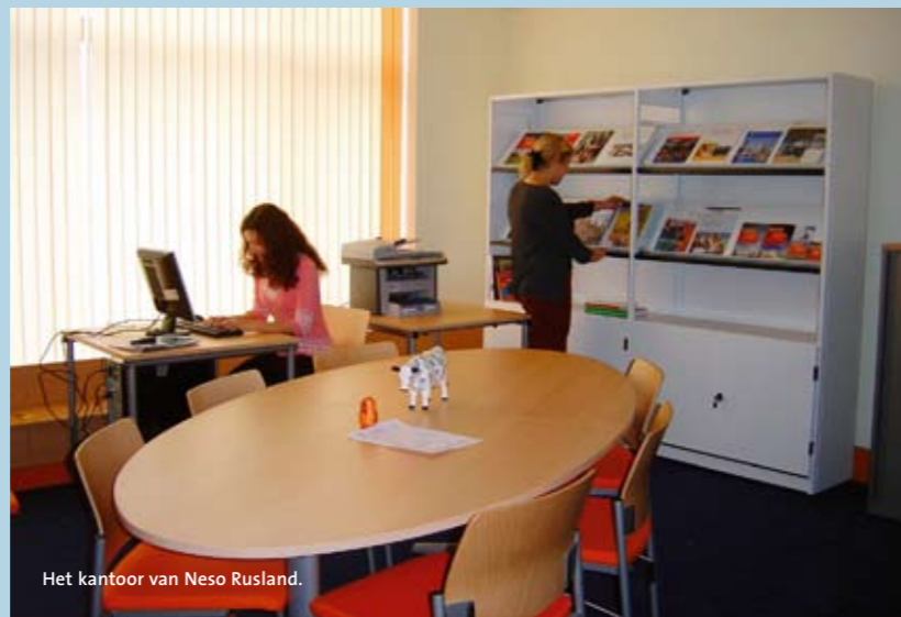
Het kantoor van Neso Rusland.

seminar in Moskou over Russisch-Nederlandse samenwerking in het hoger onderwijs. Verder geven topmannen van Nederlandse bedrijven die zich in Rusland hebben gevestigd, mini-MBA's voor Russische alumni en Russische studenten van de internationale studentenorganisatie AIESEC. (EB)