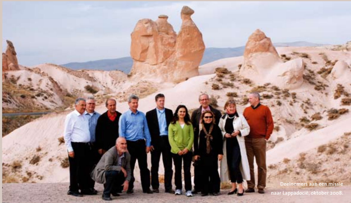
Deelnemers aan een missie naar Lappadocië, oktober 2008.