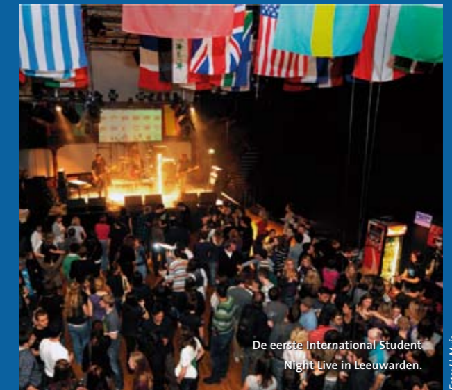
De eerste International Student Night Live in Leeuwarden.

rende studentenorganisaties willen dat zij elkaar vaker ontmoeten. Langerak: "Vanuit de hogescholen wordt weinig ondernomen om buitenlandse studenten te integreren. Ze steunen onze organisaties wel, maar laten het verder helemaal aan ons over." (EB)