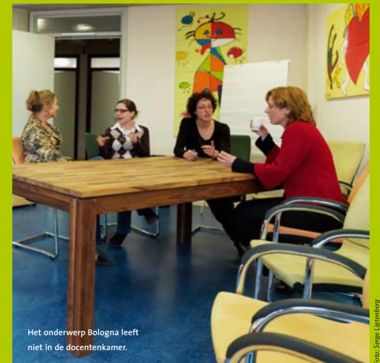
Het onderwerp Bologna leeft niet in de docentenkamer.

Dit is de vijfde aflevering in een serie over het Bologna-proces.