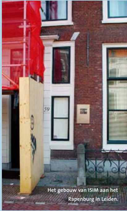
Het gebouw van ISIM aan het Rapenburg in Leiden.

Het Internationale Instituut voor de studie van de Islam in de Moderne wereld (ISIM) bestaat sinds 1 januari niet meer. Het islaminstituut kan de eigen basisbegroting van 1,8 miljoen euro niet rond krijgen nu rijkssubsidies zijn opgedroogd. Een internationale visitatiecommissie beoordeelde de kwaliteit en de levensvatbaarheid van ISIM vorig jaar nog als “uitmuntend”.